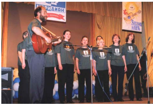
Исполнение «Под музыку Вивальди» (муз.обр. В.П.Ильина для хора ФТИ им.А.Ф.Иоффе РАН) на конкурсе «Весенняя капель-2002».