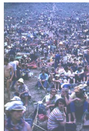
Зрители в ожидании заключительного ночного концерта 12-го Грушинского фестиваля. 1979