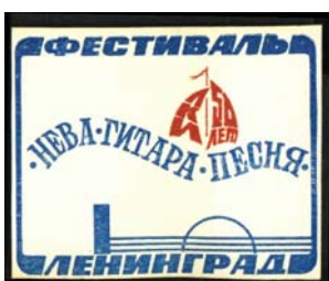
Лицевая сторона значка, подготовленного для несостоявшегося фестиваля 1980 года. Черная рамка – фантазия автора.