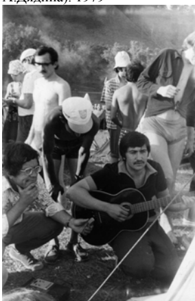
Наум Паскару на 12-ом Грушинском фестивале. 1979.