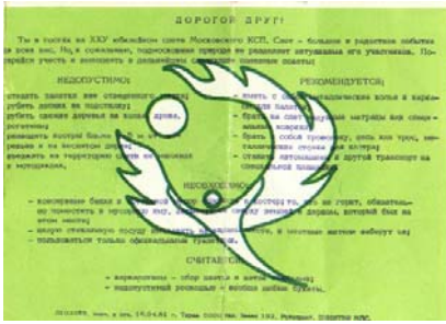
Памятки участникам 25-го Московского КСП