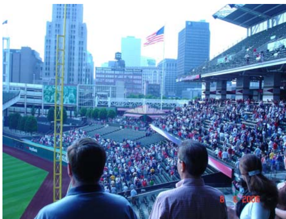
Исполнение гимна страны смешанным хором ( на фото не виден) перед началом бейсбольного матча в Кливленде.2006