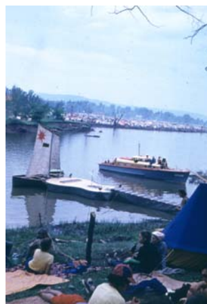
Сцена для заключительного концерта 12-го Грушинского фестиваля. На заднем плане – палаточный город с населением около 100 тыс.чел..1979