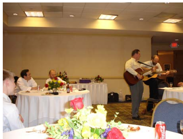
«Второй» вечер авторской песни в Кливленде.2006