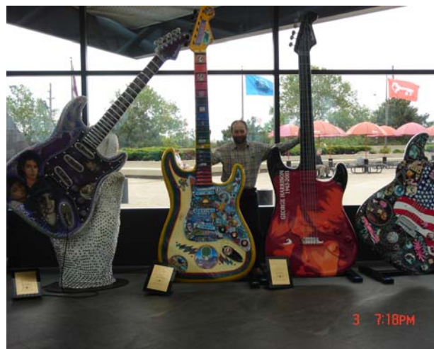
Фойе Музея Рока в Кливленде (единственное место в музее, где разрешено делать снимки). 2006