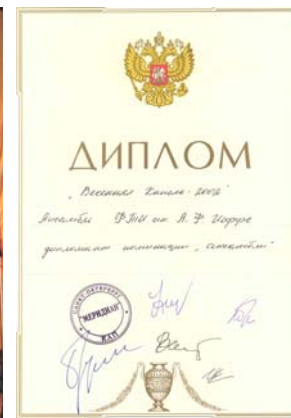
«Под музыку Вивальди» до сих пор в репертуаре хора ФТИ им.А.Ф.Иоффе РАН.