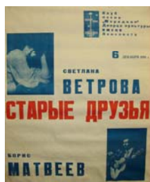
Афиша концерта, посвященного ...летию творческой деятельности С.Ветровой.