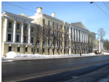
СПБ, Московский пр., д.17